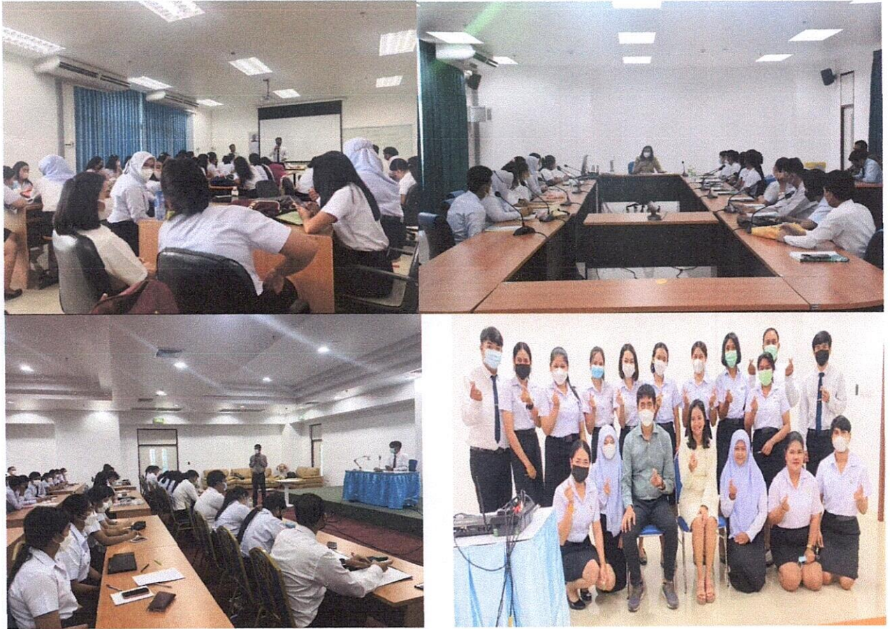
การประชุมนิเทศนักศึกษา ก่อนออกฝึกประสบการณ์วิชาชีพครู ระดับหลักสูตร