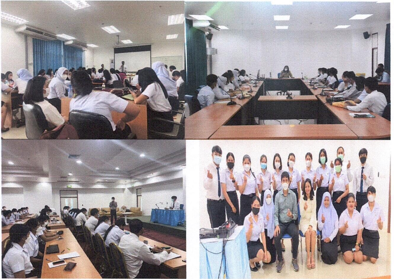
การปฐมนิเทศนักศึกษา ก่อนออกฝึกประสบการณ์วิชาชีพครูระดับหลักสูตร