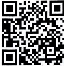
QR code สำหรับลงทะเบียน

ผู้ที่มีความประสงค์ร่วมนำเสนอผลงานวิจัยสามารถลงทะเบียนสมัครได้ที่ https://research.kpru.ac.th/std-conference๓ หรือทาง QR code ที่อยู่ด้านล่างนี้ โดยชำระค่าลงทะเบียน หลังการส่งบทความเข้าระบบ เพื่อเป็นการยืนยันการส่งบทความให้พิจารณาเข้าร่วมการประชุมวิชาการ