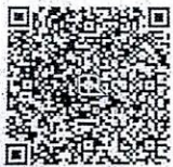
E - Donation