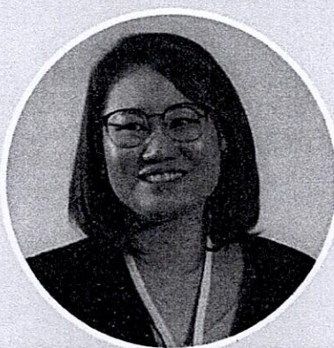
พต.ดร.น้ำค้าง ศรีวัฒนาไรท์