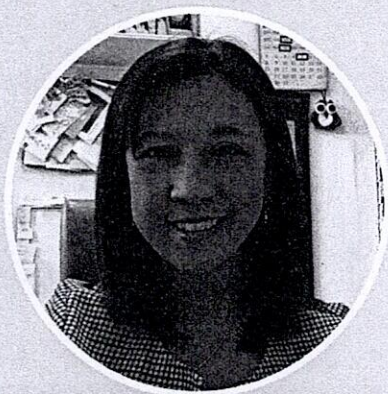
พต.ดร.ปิยะฉัตร จิตต์ธรรม