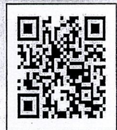
QR Code ใบสมัคร