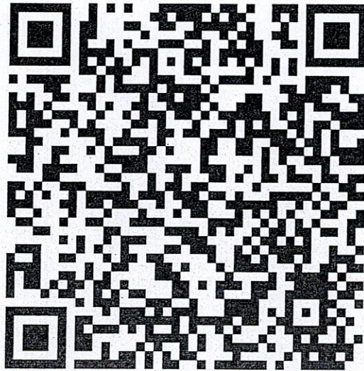
รูปที่ 1 QR Code ไปสเตอร์ประชาสัมพันธ์