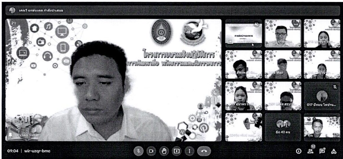
ภาพที่ 3 อบรมเชิงปฏิบัติการ “การจัดป๋ายนิทรรศการ”