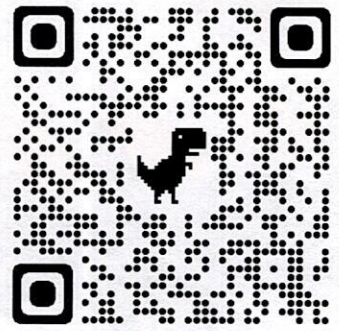
QR CODE สมัครอบรม จป.หัวหน้างาน