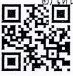
QR Code seat