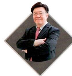
รศ.ดร.สมภพ มานะรังสรรค์ อธิการบดี สถาบันการจัดการปัญญาภิวัฒน์