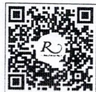
QR CODE สำหรับจองห้องพัก โรงแรมรอยัลริเวอร์

โทรศัพท์: ๐๒-๔๒๒-๙๒๒๒ โทรสาร : ๐๒-๔๓๓-๕๘๘๐ E-mail : rsvn@royalriverhotel.com