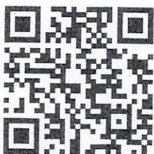
QR Code: Poster