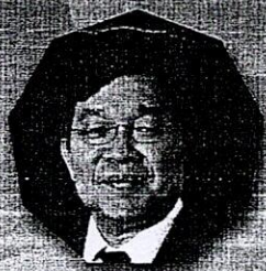
รศ. สมบัติ ศิลธรรม ปลัดกระทรวงการอุดมศึกษา วิทยาศาสตร์ วิจัยและนวัตกรรม