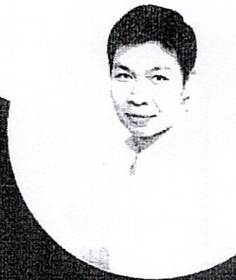
วิทยากรการอบรม

รองประธานคณะกรรมการจริยธรรมการวิจัยในมนุษย์ สาขาวิชาคณะที่ 3 ศูนย์จริยธรรมการวิจัยในมนุษย์ มหาวิทยาลัยขอนแก่น