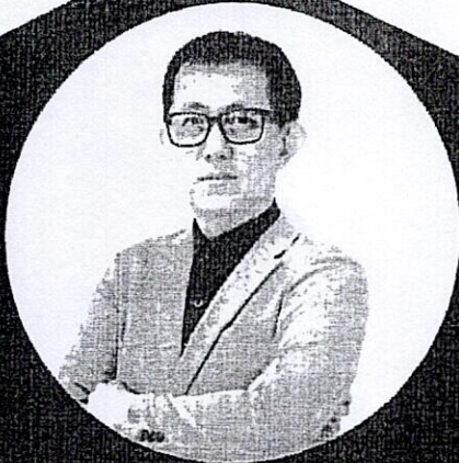
วิทยากรการอบรม

ณ โรงแรม สตาร์เวลมาหลิ รีสอร์ท อำเภอเมือง จังหวัดนครราชสีมา