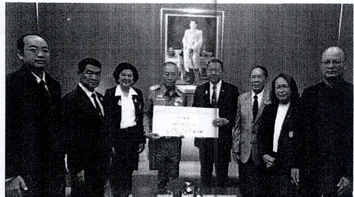
สนับสนุนทุนการศึกษามูลนิธิพระดาบส ประจำปี ๒๕๖๒ จำนวนเงิน ๖๗๕,๗๙๙ บาท

ติดตามผลงานได้ที่ www.thaiawards.org https://www.facebook.com/thaiaward