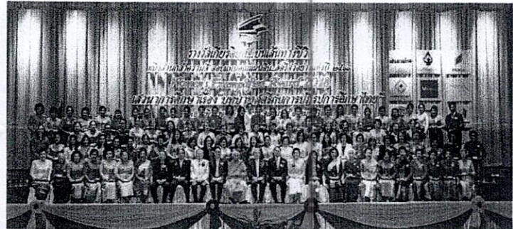
สตรีตัวอย่างแห่งปี ๒๕๖๑