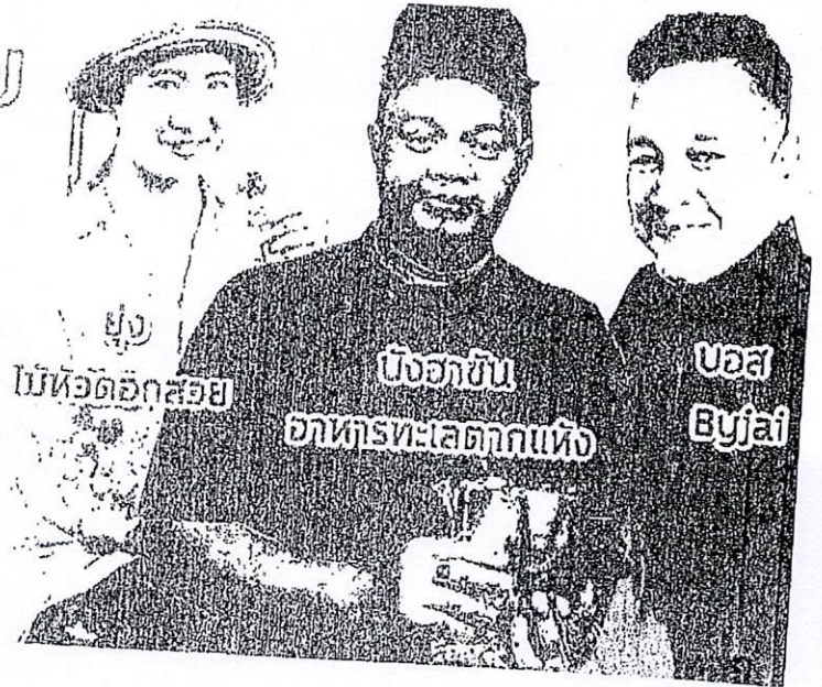
ผู้ประกอบการออนไลน์ที่ประสบความสำเร็จ