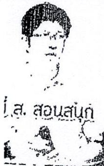
โ.ส. สอนสนอก