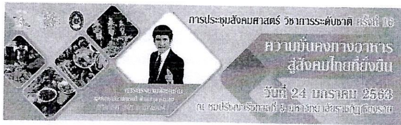
ภาพ 1 [พิมพ์เนื้อหาตรงนี้] (ถ้ามี)