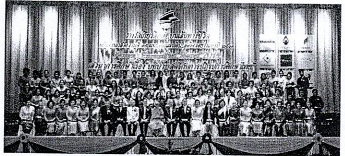
สตรีตัวอย่างแห่งปี ๒๕๖๑