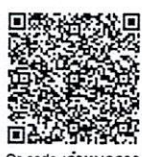
เรียน อธิการบดี